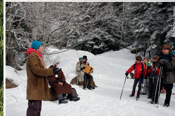
Science, musique, randonnée, la nature dans tous les sens.