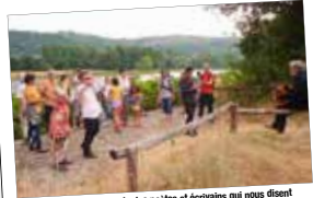
Au bord du Rhône, les mots des poètes et écrivains qui nous disent la nature et le fleuve.